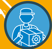
Ersatzteile mit höchster Effizienz