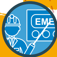
Fernausbildung des Personals