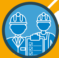
Assistenza remota durante l'installazione