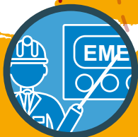
Addestramento remoto del personale